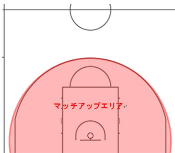
【図1】 マッチアップエリア

1-2-2 ディフェンスを始める位置は定めないが、3ポイントラインの内側を目安とするマッチアップエリア内では、このマッチアップのルールが常に適用される。(図1 マッチアップエリア 参照)