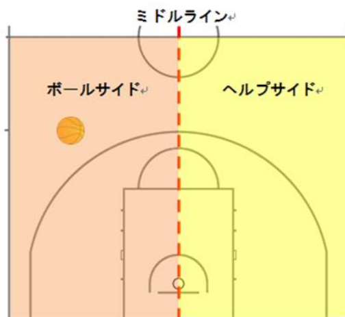
【図2】ミドルラインとボールサイド・ヘルプサイド