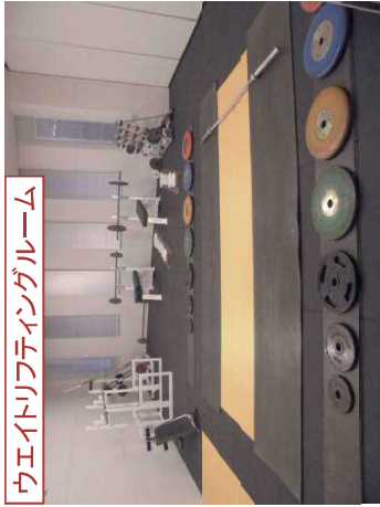
ウェイトリフティングルーム