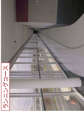
ランニングコース